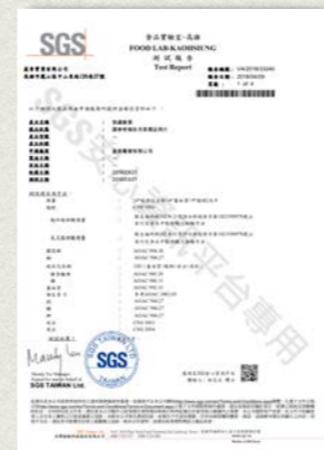
慈禧最愛-脂肪酸檢測