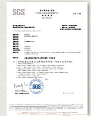
四季(平安)-470項農藥檢測

更多商品的檢驗資料，請上 SGS 安心平台網站查詢：盈香實業 http://twap.sgs.com/sgssip/Report_Query.aspx