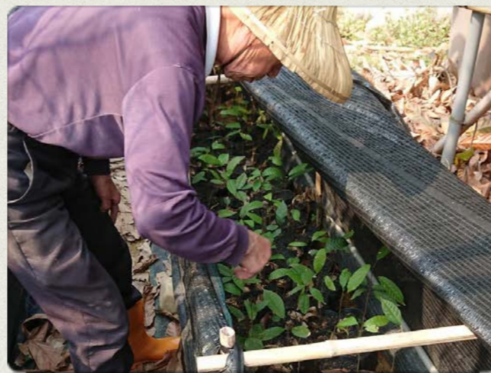
屏東萬巒可可苗種植