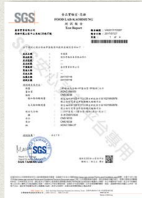
老薑露-脂肪酸檢測