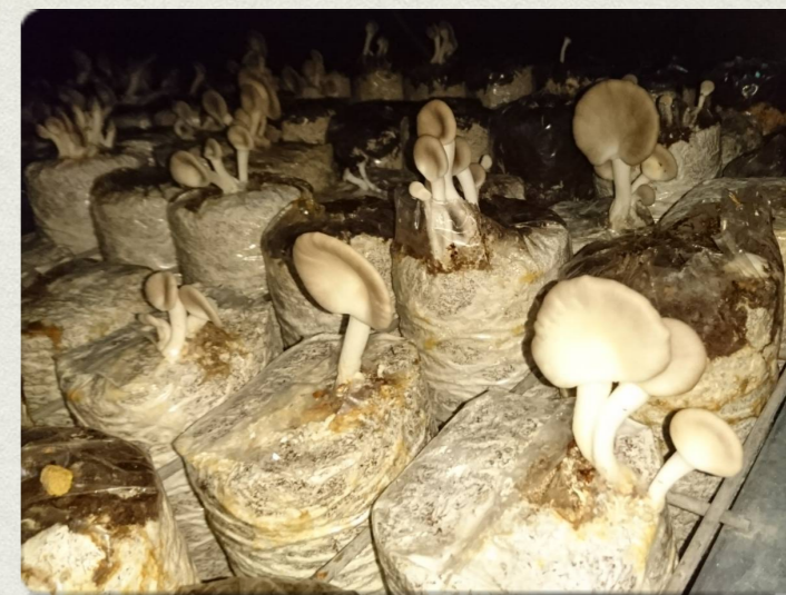
黑木耳栽培與採收