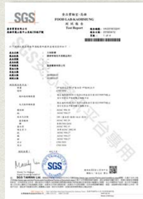
九制香檬-脂肪酸檢測