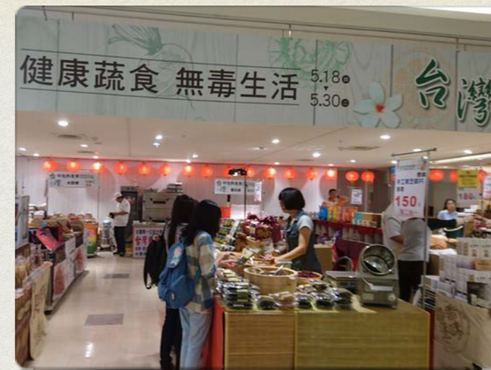
台灣健康蔬食無毒生活展售會