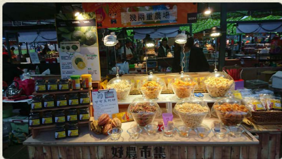
臺中花博好農市集