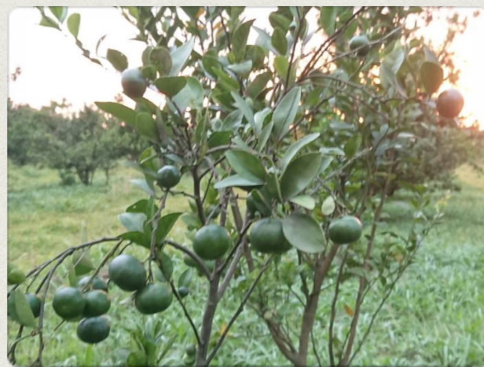
香檬農場種植一景