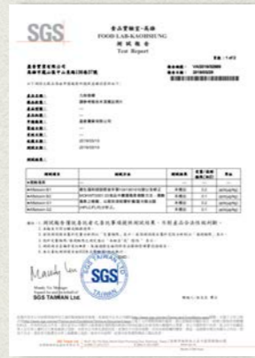
九制香檬-黃麴毒素檢測