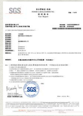
九制香檬-470項農藥檢測