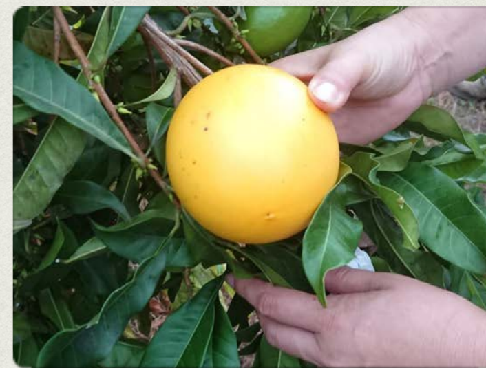
新商品『牛奶果』研發進行中