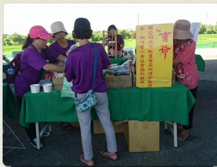
台南六甲老人福利義賣會