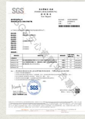
可可豆-黴菌、黃麴檢測