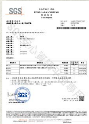
老薑露-重金屬檢測