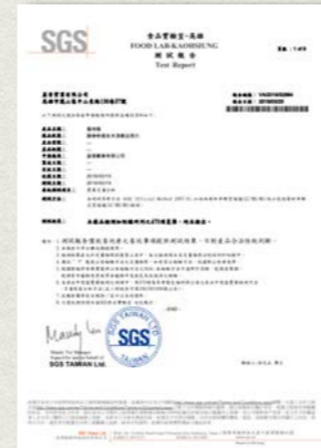
蜜柑橘-470項農藥檢測