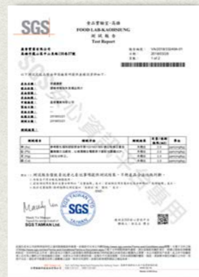
慈禧最愛-重金屬檢測