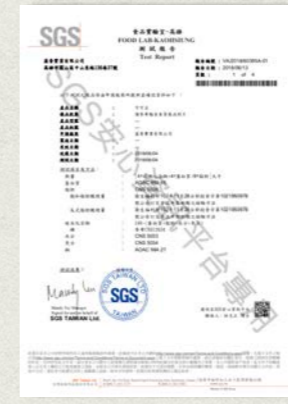
可可豆-脂肪酸檢測